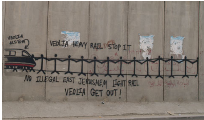
Graffiti op de muur bij Ramallah

De directeur van SNS Asset Management – onderdeel van SNS Bank - maakte vorige week in een brief haar standpunt bekend over uitsluiting van Veolia. De bank heeft in Veolia geïnvesteerd met een aantal duurzame fondsen en pensioenfondsen.